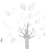
やました ようぞう 山下 陽三